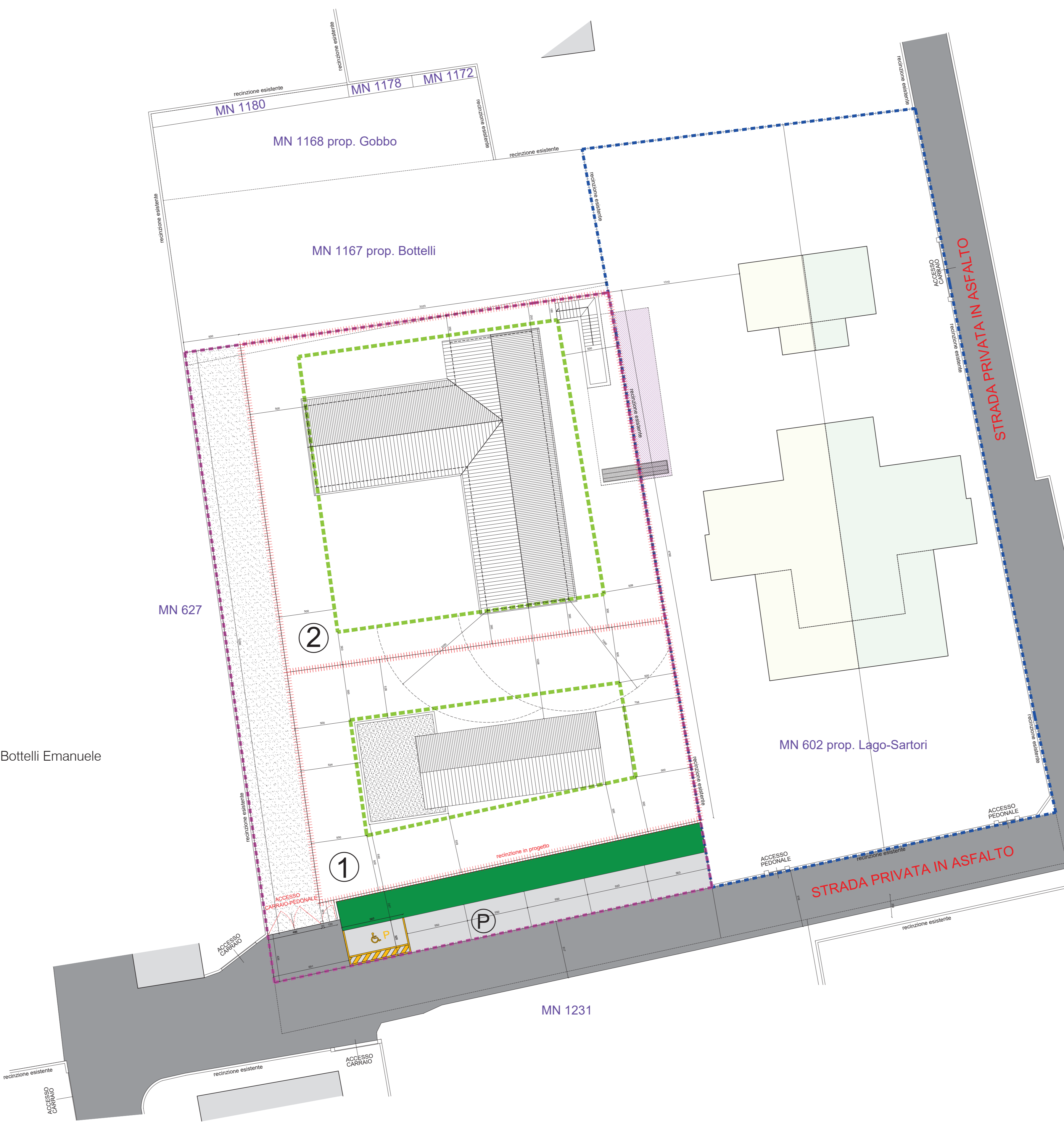
planimetria PROGETTO sc. 1.200